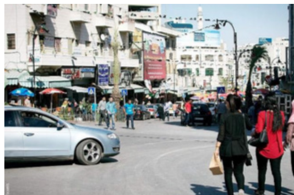
Foto: Palestiina pealinna Ramallah kesklinn, 2008