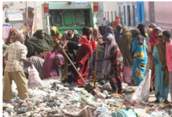
Foto: Töölised ja vabatahtlikud koristavad prahti pealinn Mogadishu tänavatelt, 2012