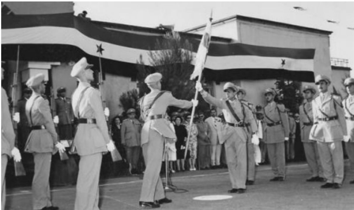
Sõjaväehvitserid tähistavad Süüria iseseisvuspäeva 1963. aastal.

1963. aastal tuli 8. märtsi revolutsiooni tulemusena võimule sotsialistlik Baath partei ja 1966. aastal sai parteis toimuva sisemise võimupöörde käigus kaitseministriks praeguse presidendi Bashar al-Assadi isa Hafez al-As.