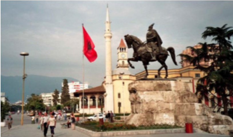
Foto: Albaania pealinna Tirana kesklinn – Skanderbegi väljak (Daniel Ursprung)