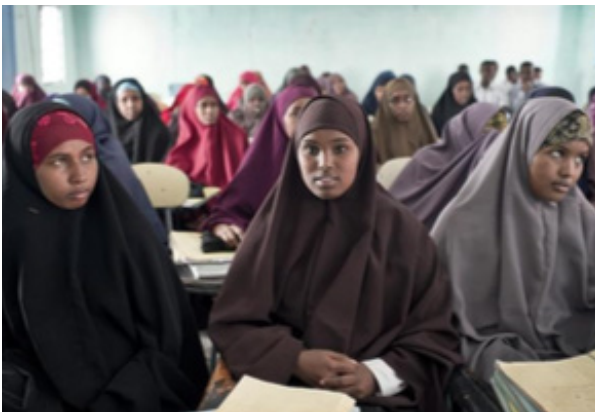
Foto: Somaalia naised stipendiumiprogrammi raames õppimas