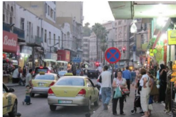
tänavapilt, 2011