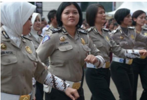
Foto: Indoneesia naispolitseinikud