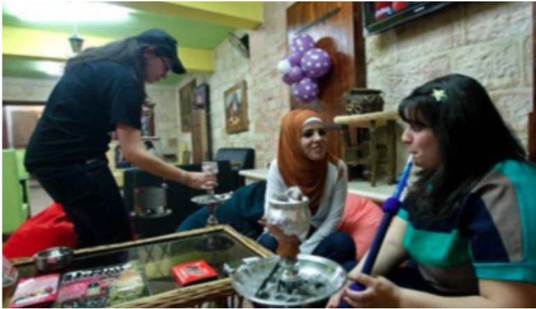
Foto: Palestiina naised kohvikus vesipiipu suitsetamas, Ramallah, 2012