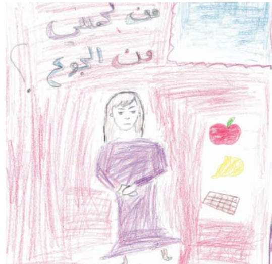
„Kes kaitseb mind nälja eest?“ (Eman, 12-aastane tüdruk Homsist)

Kuigi Süüria laste jaoks on haridus väga oluline, on koolitee, nagu ka kool ise, muutunud ohtlikuks kohaks. Lapsed ja nende vanemad kardavad, et lapsed satuvad kooliteel rünnaku või snaipritule alla või arreteritakse lapsed. Lisakatsumuseks on igapäevane arvukate kontrollpunktide läbimine.