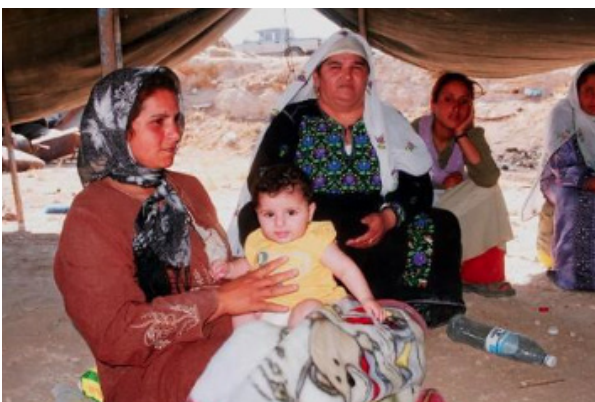
Foto: Palestiina beduiinipere, 2010