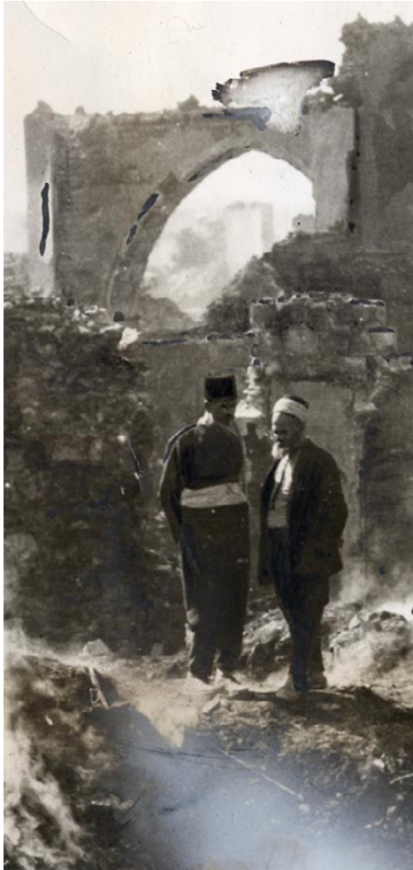
Foto Briti ajalehest Daily Mail, 05/11/1925: „Damaskus peale prantslaste pommitamist: varemtes elukvartal”

piirkonnaks, mis kattusid etniliste/usuliste kogukondadega: rannikule jäi alaviitide (alaviidid on moslemite usurühm, keda loetakse vahel šiitide hulka kuuluvaiks, vahel aga eraldi usurühmaks) ala, lõunasse jäi druside ala ja kolmas piirkond koondas sunni moslemeid. Süürlased ei leppinud prantsuse võimuga ja rahvusliku liikumise tulemusena toimus Süürias 1925 ja 1926 ülestõusude laine, mille eesmärgiks oli koloniaalvõimudest lahti saada. Prantsuse võimud surusid ülestõusud maha üsna jõhkrate meetoditega.