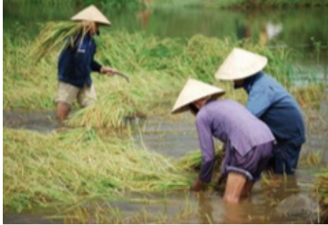
Foto: Riisifarmerid saaki koristamas, Hoi An

Erinevad rätid, loorid ja muud peakatted olid tavalised väga paljudel maadel ammu enne seda, kui 7. sajandil sai Araabia poolsaarelt alguse islamiusk. Islamiusu levides võeti islamisse üle mõned kohalikud peakatted või vastupidi: islamiusk avaldas mõju kohalike peakatete väljanägemisele. Ka tänasel päeval on peakate oluline element paljudes religioonides, nt katoliikluses või judaismis. Peakate on ka paljudes riikides usust sõltumatu element: nt. Vietnami põllumeeste bambusmütsid või Lähis-Ida meeste ruudulised rätid: kuffiyad.