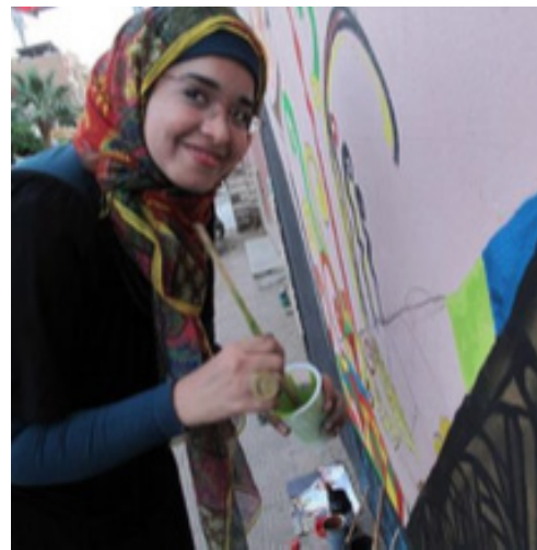
Foto: Egiptuse naine graffitit teemas, Women on Walls

Naiste endi jaoks väljendab peakatte kandmine väga erinevaid sõnumeid: see võib olla naise enda valitud religioossuse väljendamise vahend; see võib olla peretraditsioonide või kogukonna poolt eeldatav riietus ja naisel on mugavam seda kanda, kui hakata selle üle tülitsema; see võib olla ka protestimärk, kus naine oma pearätiga ütleb, et tal on õigus praktiseerida oma usku või traditsioone.