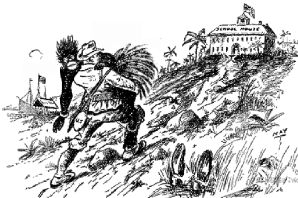
„Valge mehe koorem“ – Thomas May, The Journal (Detroit)

Näidake õpilastele pilti „Valge mehe koorem“ (The Journal, Detroit, 1898). Paluge neil mõne minuti jooksul kirja panna, mis on nende arvates valge mehe koorem. Seejärel võtke teema kokku terve klassiga (vt. all).