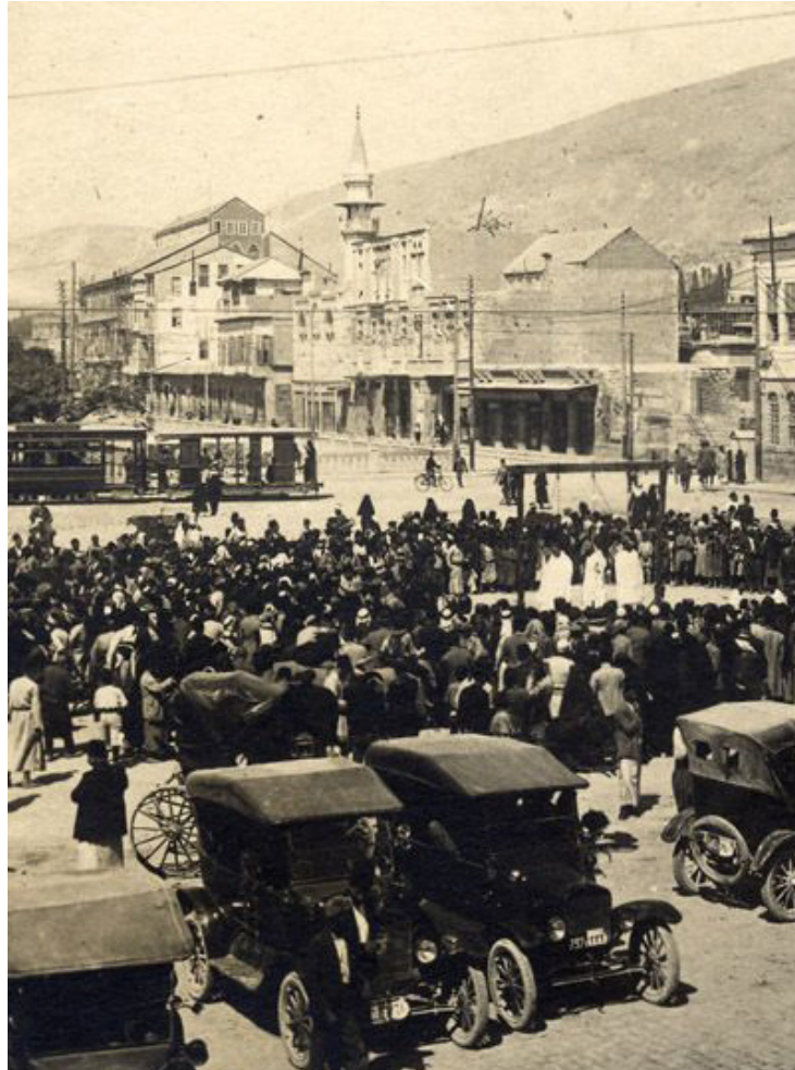
Luigi Stironi fotol on jäädvustatud Süüria revolutsiooni juhtide hukkamine (poomine), mille viisid täide prantsuse mandaatvõimude esindajad Damaskuse kesklinnas 1926. a.